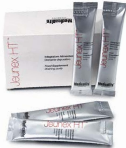
Stick-pack Confezione da 14 stick-pack