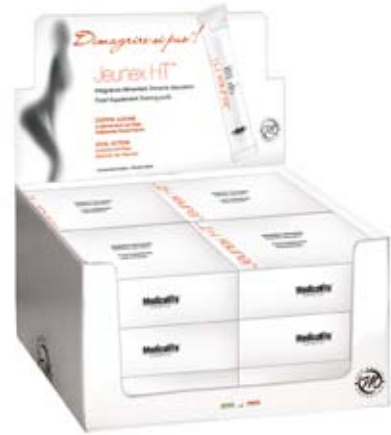
Expo da 12 scatole

Dalla ricerca Medicallife, il primo integratore attivo, ad azione drenante e depurativa, formulato solo con sostanze naturali. Nella sua pratica confezione monodose, diventa un compagno insostituibile della nostra giornata; stress quotidiano e alimentazione sregolata, purtroppo a volte fanno parte della nostra giornata, l'integratore Jeunex HT vi aiuta ad eliminare le tossine in eccesso e a ristabilire il giusto equilibrio, favorendo l'eliminazione di gonfiori e accumuli di liquidi indesiderati. Il prodotto è formulato con materie prime naturalmente prive di glutine.