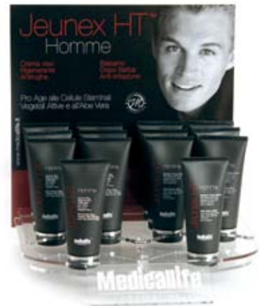
Expo da 14 pezzi